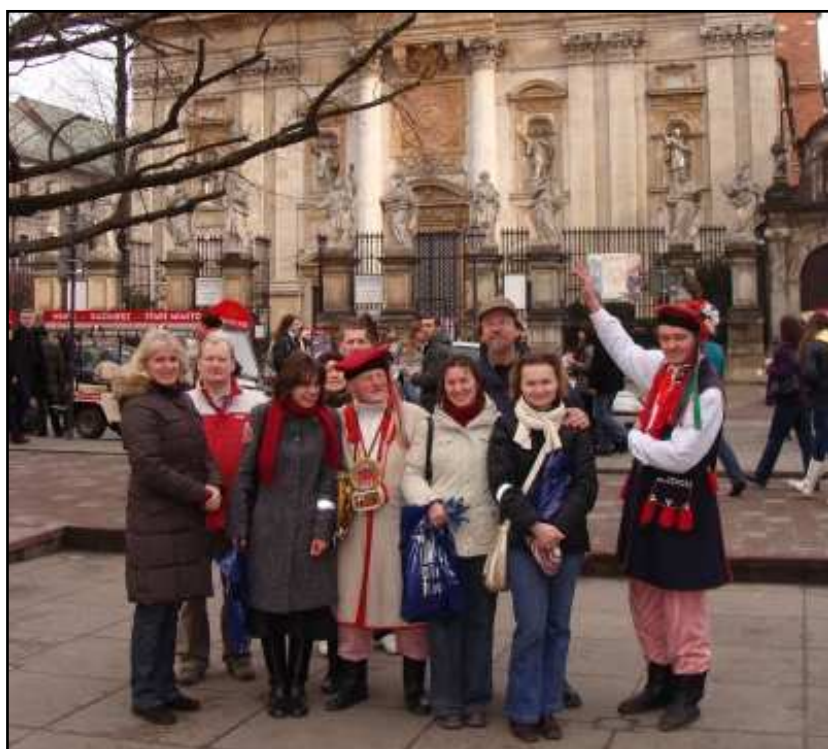
Grupa uczestników przed kościołem pw św.św. Piotra i Pawła na ul. Grodzkiej